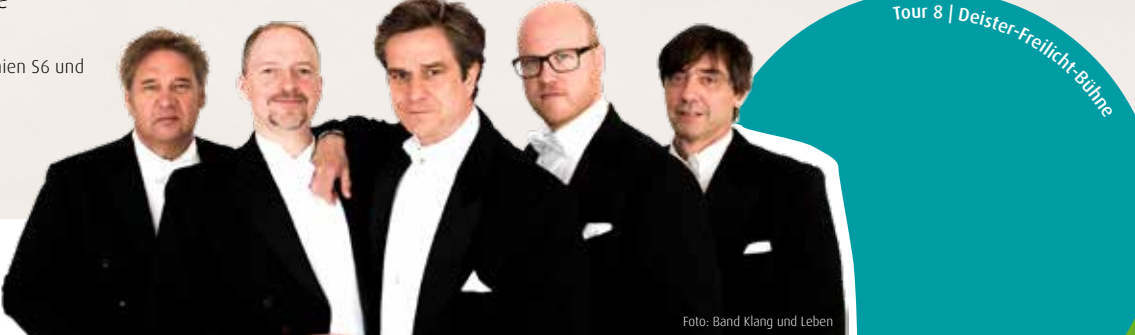
Tour 8 | Deister-Freilicht-Bühne

Maschstraße 22-24, 30169 Hannover | ÜSTRA Linien 1, 2, 4, 5, 6, 8 und 11, Buslinien 100, 120 und 200, Haltestelle „Aegidientorplatz“; ÜSTRA Linien 1,2 und 8, Haltestelle „Schlägerstraße“