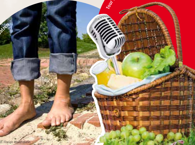
Tour 11 | Park der Sinne Laatzen