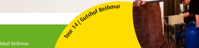
Tour 14 | Gutshof Rethmar

Nachhaltiges und klimaneutrales Bauen! Bei den Spaziergängen mit Zukunftsblick in der Null-Emissions-Siedlung zero:e-Park erfahren sie von pro Klima-Expertinnen und Experten